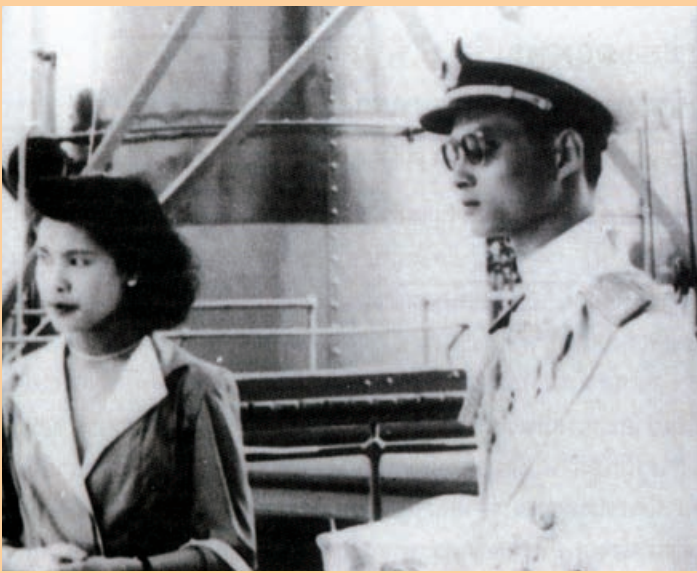
๓ พระบาทสมเด็จพระเจ้าอยู่หัว เสด็จนิวัติพระนคร พร้อมด้วย ม.ร.ว. สิริกิติ์ กิติยากร เมื่อ ๒๔ มีนาคม ๒๔๙๓

รัฐบาลได้กราบบังคมทูลเชิญพระบาทสมเด็จพระเจ้าอยู่หัวอาเนันทมหิดล ซึ่งขณะนั้นทรงพระชนมายุครบ ๒๐ พรรษา เสด็จกลับมาประทับเป็นมิ่งขวัญของประชาชนชาวไทยโดยพระเจ้าน้องยาเธอฯ เสด็จฯ กลับมาด้วยถึงประเทศไทย เมื่อวันที่ ๕ ธันวาคม พ.ศ.๒๔๙๔ อันตรงกับวันพระราชสมภพ โดยทั้งสยามที่มาขึ้นชมพระบารมี หากรู้ไม่ว่าพระอนุชาจะทรงต้องเสด็จกลับไปศึกษาต่อในฐานะพระมหากษัตริย์ของสยามประเทศแทนพระเชษฐาธิราชด้วยความโทมัสพระทัยเป็นที่สุด ขณะมีพระชนมายุเพียง ๑๙ พรรษาเท่านั้น