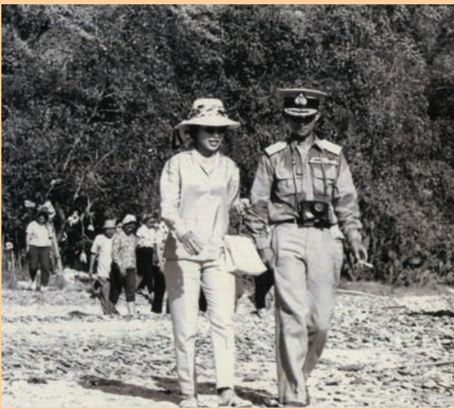
สมเด็จพระนางเจ้า ฯ พระบรมราชินีนาถทรงตามเสด็จ ฯ พระบาทสมเด็จพระเจ้าอยู่หัวในทุกถิ่นที่

ราษฎรมาเรื่อยๆ ที่นี้ข้าพเจ้าก็รู้สึกได้ว่า แห่มานานเหลือเกิน ตอนนั้นยังไม่กางร่ม ตอนนั้นยังไม่ค่อยกลัวแดด ไม่ใส่หมวก ก็รู้สึกแดดเปรี้ยง หนึ่งเท่านี้รู้สึกใหม่เขียว ก็เดินเข้าไปกระซิบท่านว่า พอหรือยัง ก็โดนกริ้ว “นี่เห็นไหมราษฎรเขาเดินมาเป็นวัน ๆ เพื่อมาดูเราแม่แต่ชนิดนี้คนเดียว แต่เรายืนอยู่ไม่เท่าไรละตอนนี้ทนไม่ไหวเสียแล้ว” พระราชดำรัสสมเด็จพระนางเจ้า ฯ พระบรมราชินีนาถ วันที่ ๑๑ สิงหาคม พ.ศ.๒๕๓๔