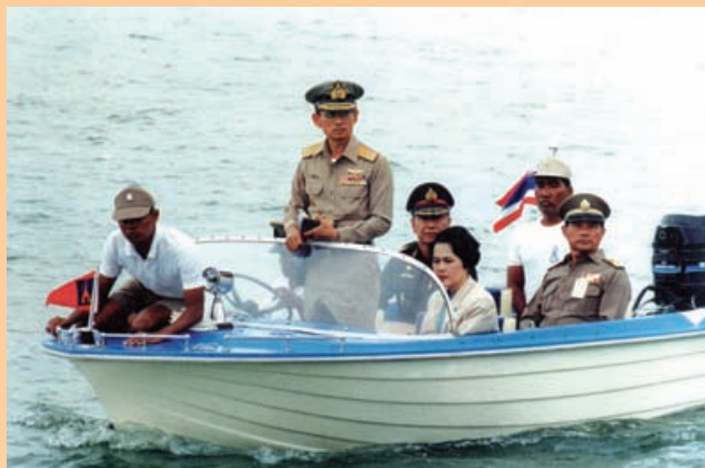
■ สันเกล้าฯ ทั้งสองพระองค์ประทับในเรือยนต์เล็กเพื่อเสด็จฯ ยังเรือ ต.๙๙ เพื่อทอดพระเนตรการสาธิตการยกพลขึ้นบก “ยุทธการลุงเขี้ยวหางไหม้” เมื่อวันที่ ๒๗ มิถุนายน ๒๕๓๒

สมเด็จพระนางเจ้าพระบรมราชินีนาถ ยังได้ทรงมีพระราชเสาวนีย์ให้มีการจัดสร้างปะการังเทียมขึ้นตามชายฝั่งเพื่อเป็นแหล่งที่อาศัยของสัตว์น้ำ และฟื้นฟูการทำประมงชายฝั่งซึ่งกองทัพเรือและหลายหน่วยงานได้ร่วมมือกันดำเนินการตามพระ