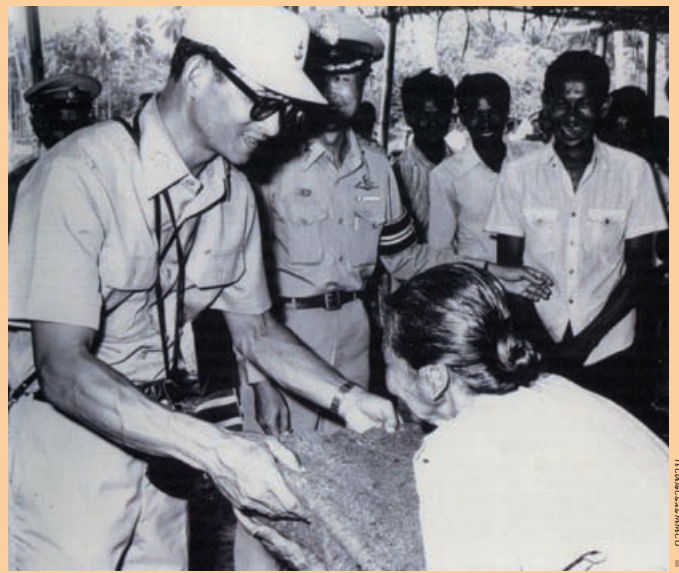
๓ พระบาทสมเด็จพระเจ้าอยู่หัวเสด็จฯ เยี่ยมเยียนและพระราชทานของแก่ราษฎร ตามหมู่เกาะต่าง ๆ ในอ่าวไทย

นับแต่สิ้นพระกระสรวงแห่งปฐมบรมราชโองการ “เราจะครองแผ่นดินโดยธรรมเพื่อประโยชน์สุขแห่งมหาชนชาวสยาม” พระราชพิธีบรมราชาภิเษก ณ พระที่นั่งไพศาลทักษิณ ในเย็นของวันที่ ๕ พฤษภาคม พ.ศ.๒๔๙๓ นั้น พระบาทสมเด็จพระเจ้าอยู่หัว ทรงได้อุทิศพระองค์เป็นตัวอย่างของการปฏิบัติพระราช