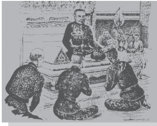
● พระบาทสมเด็จพระนั่งเกล้าเจ้าอยู่หัว ทรงโปรดให้สมเด็จพระวรวงศาเจ้ากรมพระราชวังบวร มหาศักดิพลเสพ เป็นประธานในการชำระตำราพิไชยสงคราม ฉบับหลวง เมื่อ พ.ศ. ๒๔๓๘