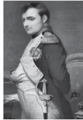
● พระเจ้าไกเซอร์ วิลเลียมที่ ๒ ของปรัสเซีย (เยอรมนี)

นโปเลียน โบนาปาร์ต ซึ่งเคยกวาดยุโรปอยู่ใต้ฝ่าเท้าตนในศตวรรษที่ ๑๙ ก็เคยอ่าน “ตำราพิไชยสงครามซุนวู” มาก่อน และคาดว่าจะได้นำไปใช้ในการปรับปรุงยุทธศาสตร์ของตนเองด้วย