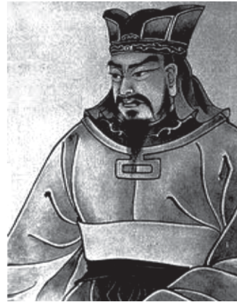
● ซุนวู นักการทหารและนักปกครอง ชาวจีน

อย่างไรก็ตาม หลักการสงครามและหลักการทางทหารที่กล่าวข้างต้นก็ยังสามารถนำมาประยุกต์ใช้เพื่อความเจริญก้าวหน้า และเพื่อการเอาชนะกันในสงครามเย็น รวมทั้งการดำเนินการทางด้านการเมือง การเศรษฐกิจ และกิจการเอกชนทั่วไปได้